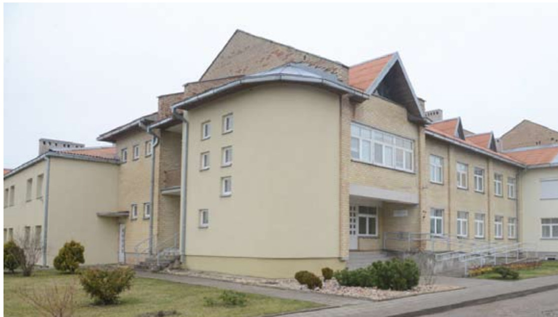
Aknystos socialinės globos namuose gyvena apie 340 globotinių.

Pirmadienį, balandžio 27-ąją, paaiškėjo, jog koronavirusu užsikrėtė Aknystos socialinių globos namų darbuotoja.