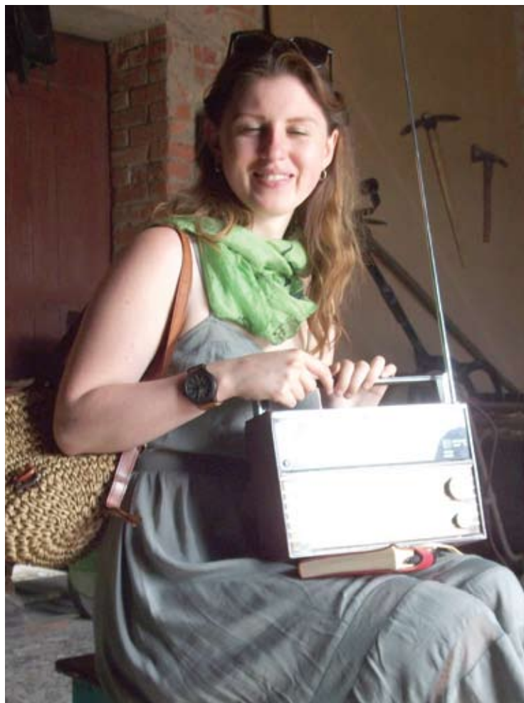
Nortautė, sena "taburetė" ir senutėlis "Vefas"...