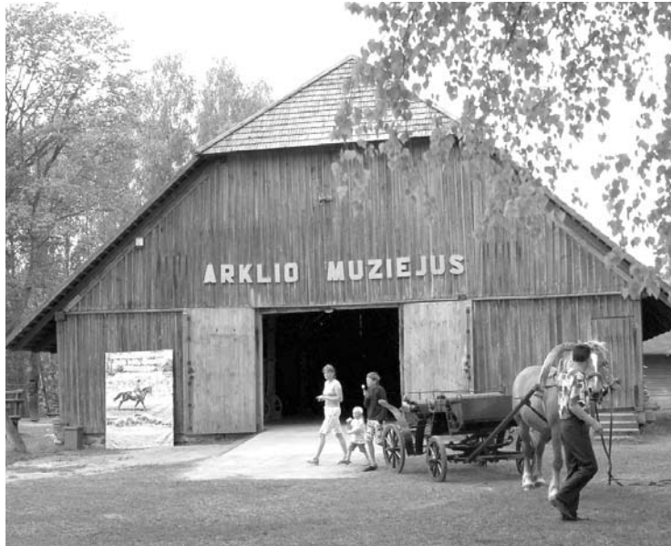
Arklio muziejus ir kiti muziejaus padaliniai vėl bus prieinami lankytojams nuo gegužės mėnesio.

2019 metais daugiausiai lankytojų sulaukė Arklio muziejus. Jame apsilankė 37 tūkst. lankytojų. Šią savaitę muziejus pranešė, kad nuo gegužės pradžios vėl lauks lankytojų. Duris atvers ir A. Vienuolio-Žukausko memorialinis muziejus, Siauruko muziejus,